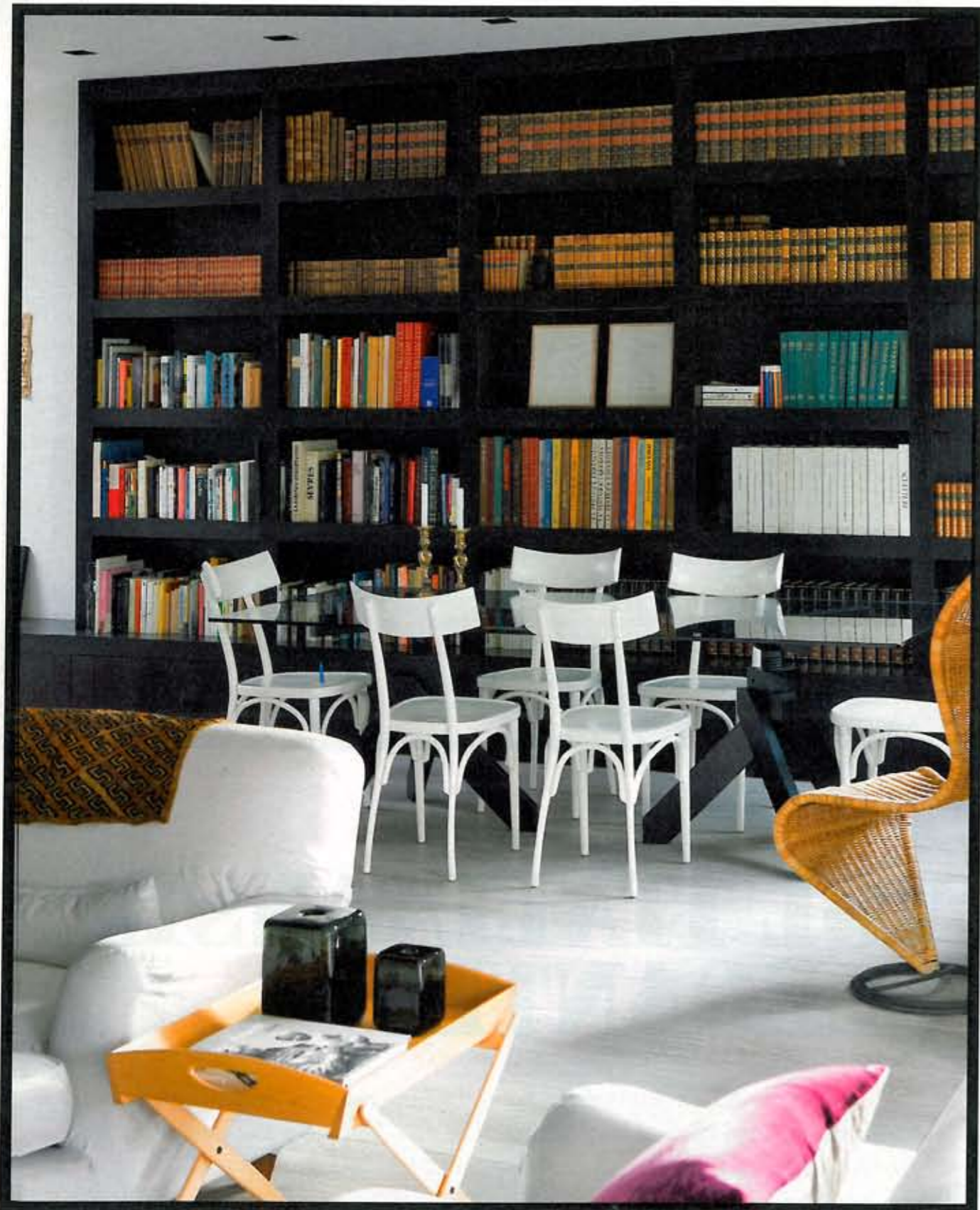
In de eethoek zorgt de hoge bibliotheek voor extra geborgenheid. De tafel is een ontwerp van Vico Magistretti voor De Padova.