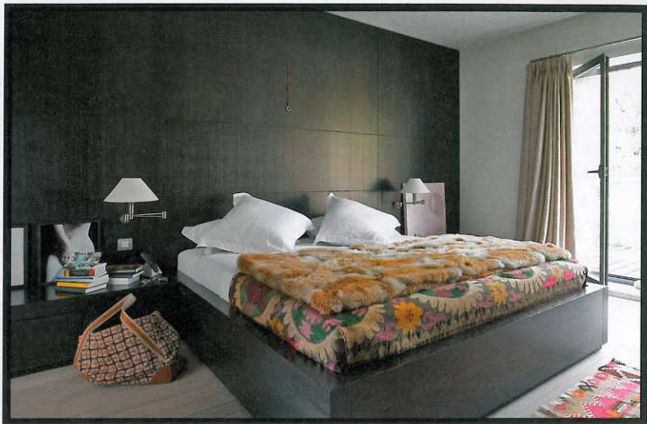
Voor meer intimiteit staat het bed tegen een donkere lambrisering, waarin enkele wandkasten verstopt zitten.